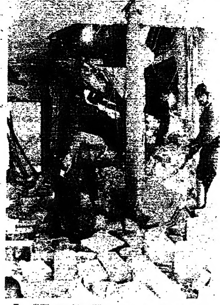
بعض رجال الأمن يبحثون بين انقاض منزل هدمته القذافي